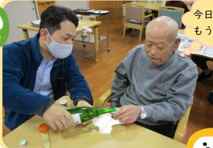
今日はとことん飲もうや！