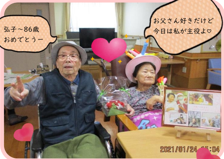
お父さん好きだけど今日は私が主役よ♡