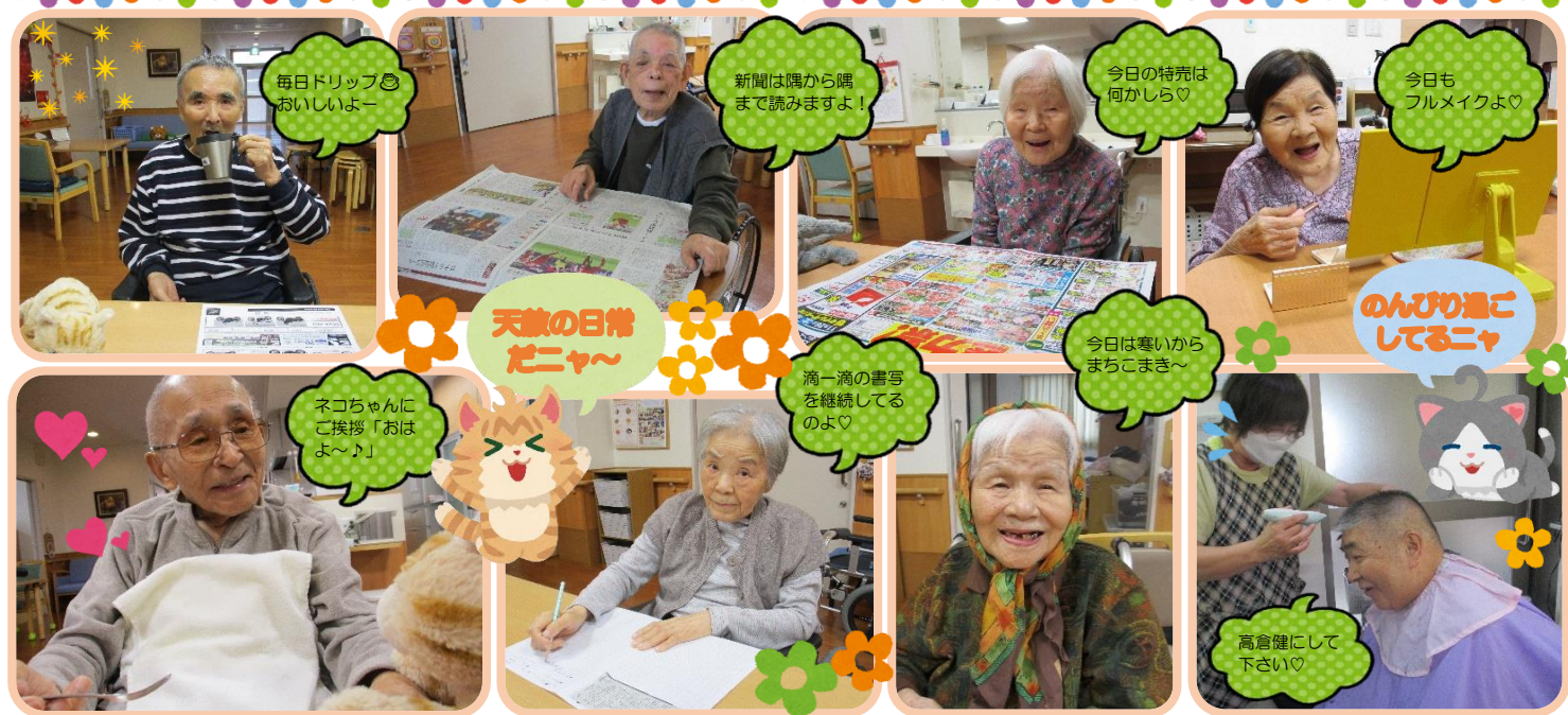
毎日ドリップ☺ おいしいよー