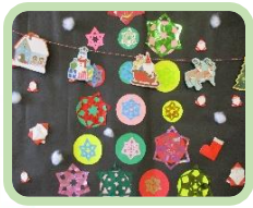
ショートステイの 利用者さんと作り ましたー

☆12月の行事予定☆ *12/3(土) 焼芋大会を行います！ *12/18日(土) クリスマス会 利用者さんと一緒にケーキを手作りし ますよー