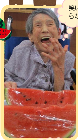
笑いが止まらない