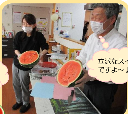
立派なスイカ ですよ～♪