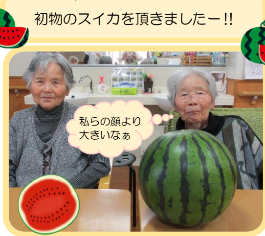
私らの顔より大きいなあ