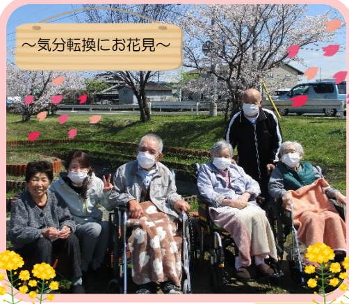
～気分転換にお花見～